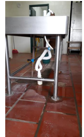
IML de Concórdia