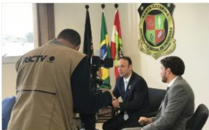
IGP Digital é destaque na RICTV Record SC

IGP Digital: 100% dos processos digitais – economia em impressões